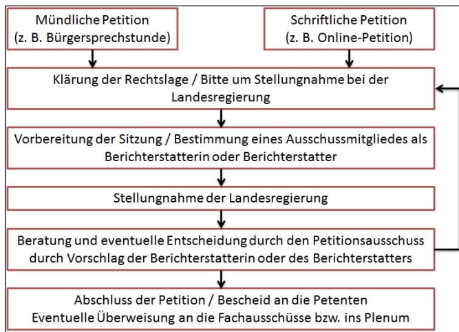
Abb. 1: Ablauf des Petitionsverfahrens

Petitionen sind weder an Fristen noch an eine bestimmte Form gebunden und sind stets kostenfrei.